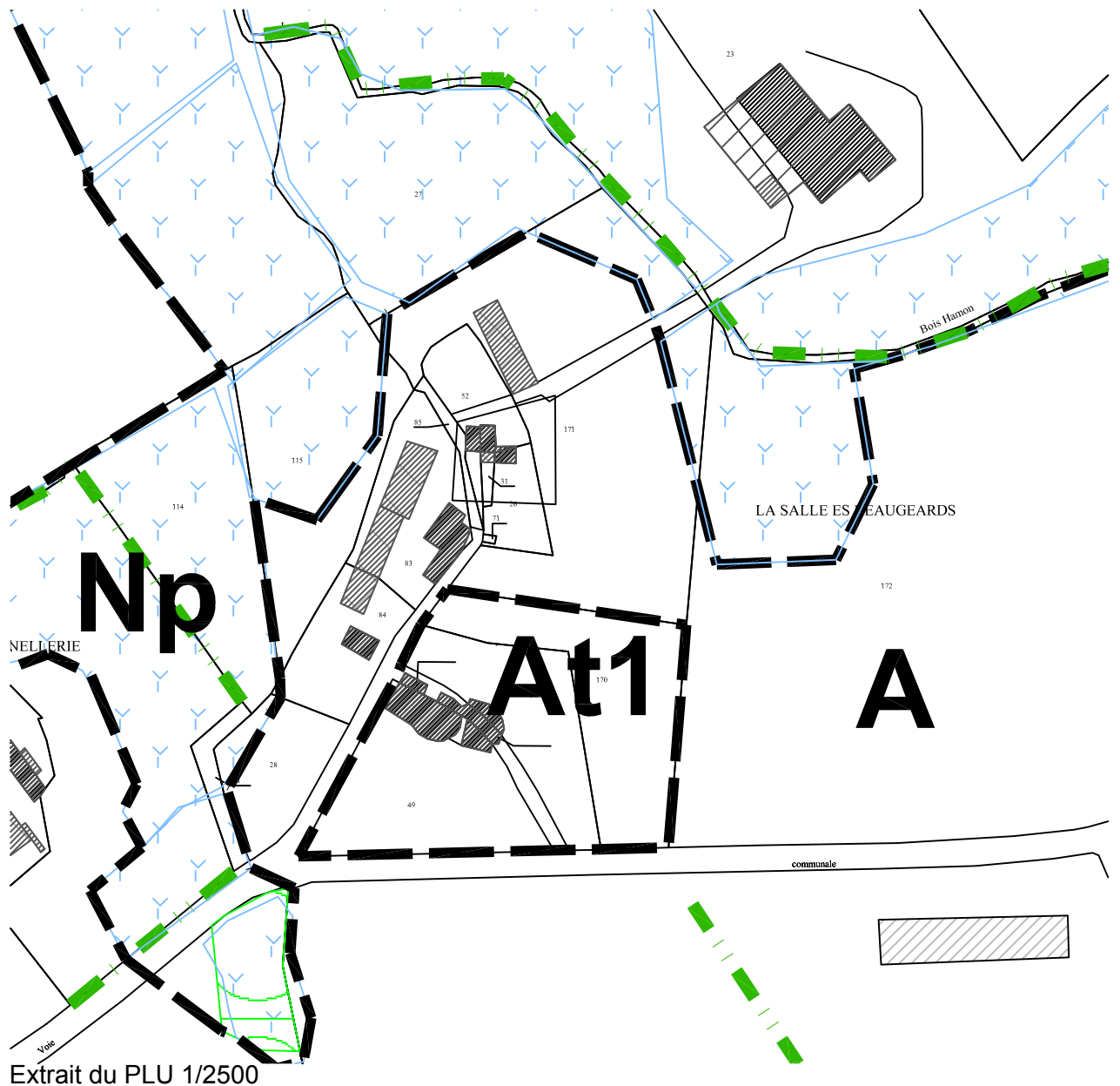
Extrait du PLU 1/2500